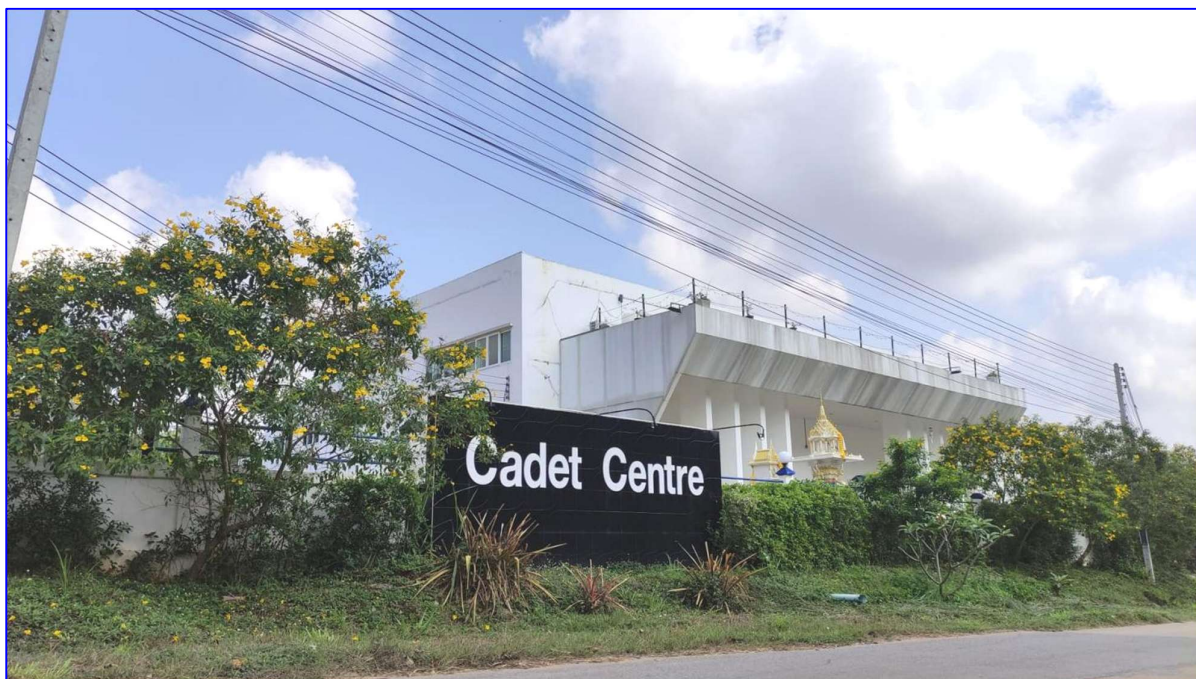
ภาพโรงเรียนกวดวิชาธนพิสิษฐ์ ซอยเขาหมอน ต.พลูตาหลวง อ.สัตหีบ จ.ชลบุรี